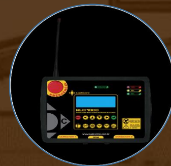
CENTRAL COM SELETORA