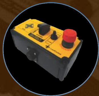
CAIXA LATERAL COM ACIONAMENTO DE BOMBA DE EMERGÊNCIA